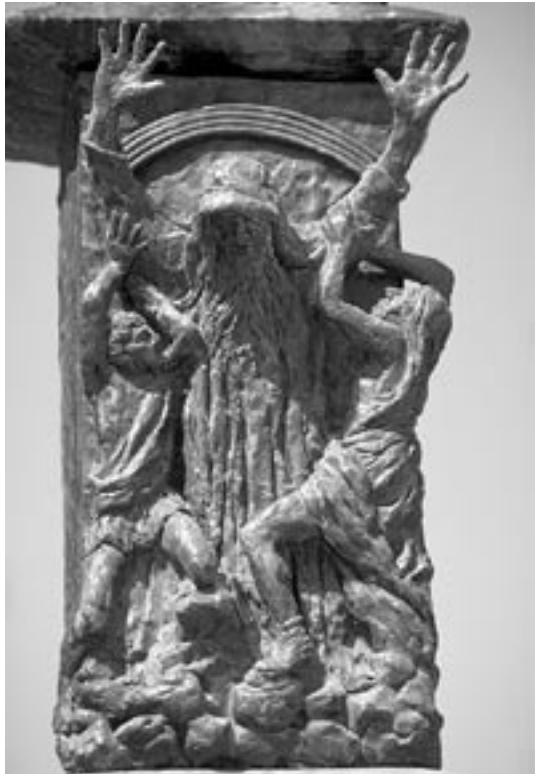
Mose mit erhobenen Händen, gestützt von Aaron und Hur. Relief auf der Menora vor der Knesset in Jerusalem.

aus: Jüdische Rundschau 23/5/96 (geschrieben zu Schawuot/Wochenfest, dem das christliche Pfingstfest entspricht)