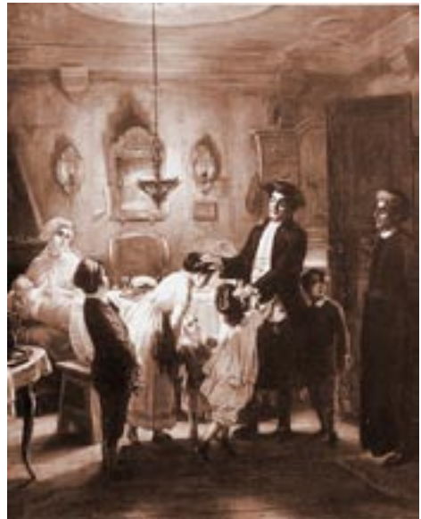
Moritz Oppenheim, Freitagabend, 1867

Für seinen konkreten Beitrag griff Oppenheim zwar auf die religiösen Traditionen seiner Jugend zurück; dennoch sind seine Bilder nicht, jedenfalls nicht nur, als konservative Rückwendung zu verstehen. Dazu war der Inhalt des Dargestellten – das war sicherlich sowohl Oppenheim selbst als auch den Betrachtern seiner Bilder bewusst – viel zu sehr idealisiert. Das Enge, Bedrückte, Ärmliche des Ghettolebens kommt in keinem der Bilder des Zyklus zum Ausdruck; diesen Aspekt blendet Oppenheim nahezu völlig aus. Vielmehr verfolgte Oppenheim mit seinen Bildern vermutlich mehrere Ziele. Zum einen ging es gewiss um die Darstel-