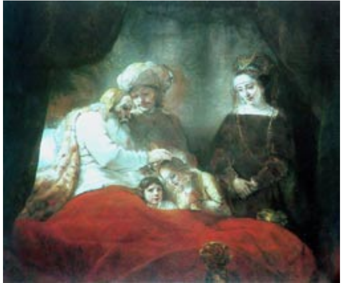
Jakob segnet Josephs Söhne, Rembrandt 1656

So schaut Rembrandts Manasse zwar fragend aus dem Bild heraus, aber keineswegs finster. So wirkt sein greiser Jakob durch und durch gütig, aber nicht geistig-verwirrt, wie es in der biblischen Erzählung mit einer kritischen Rückfrage und einer korrigierenden Segensanleitung sein Sohn Joseph von ihm andeutet (Gen 48, 17f). So